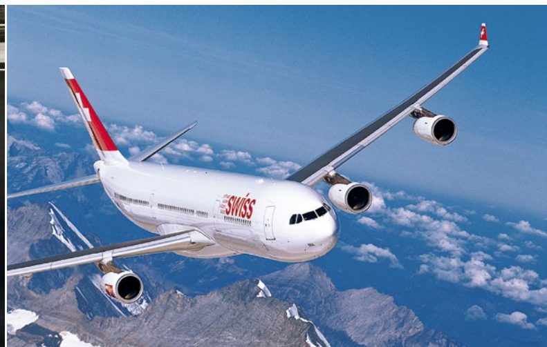
48 | Social-Media-Management