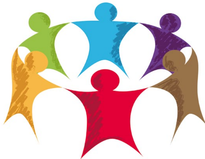
22 | Trusted Friends