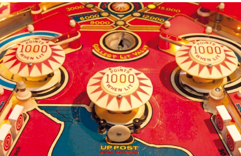
08 | Flippern statt Bowling