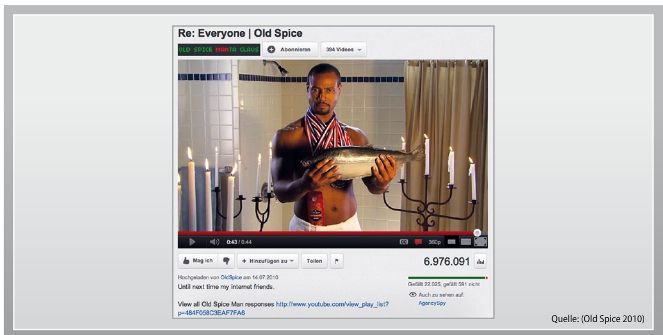
Abb. 2 Der „Old Spice Man“ im Video 186 der Old Spice-Kampagne