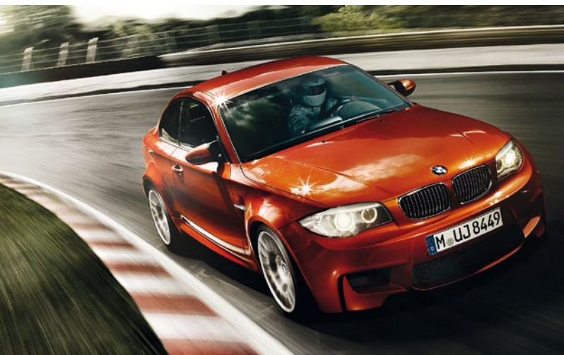
28 | Leveraging the Buzz